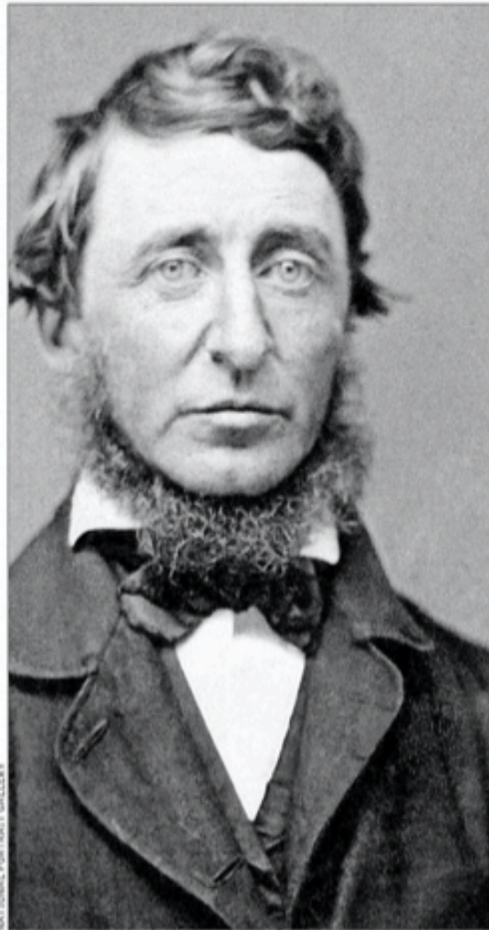
HENRY DAVID THOREAU CONCORD, MASSACHUSETTS, 817-1862

Como lo señala certeramente Pierre Hadot en su Filosofía como forma de vida , Thoreau pertenece a una tradición de pensamiento que se remonta a la antigüedad clásica, según la cual la filosofía no consiste meramente en un conjunto de postulados teóricos que plantean preguntas, discuten las respuestas que se han dado a ellas e intentan nuevas aproximaciones, sino implica un compromiso práctico del filósofo; es, en lo esencial, un modo de ser, de estar en el mundo consecuente con la ideas que se sostienen. Estas configuran la vida del pensador y, a la vez, brotan de esa vida. El pensamiento legado por Thoreau tiene, en consecuencia, un marcado carácter autobiográfico y está empujado por un poderoso impulso moral, por lo cual, lo que se persigue finalmente es una transformación individual y política que lo compromete a él mismo en un sentido fuerte. Si vivir en conformidad a la naturaleza y practicar una existencia orientada por la sencillez ("Simplicidad, simplicidad,