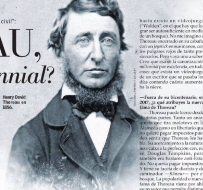
Henry David Thoreau en 1856.

era una traducción peninsular y Thoreau parecía sacado de una novela cervantina. Así que la curatorial también quería saldar cuentas con eso. Quería que fuera un libro ágil, con varios formatos: un ensayo político, otro ecológico, entradas de diario súper personales, una biografía para que el lector no interrumpa la lectura y se meta a Wikipedia. El subtítulo del libro podría haber sido "Thoreau al tuntún"; se puede entrar a él por todas partes, como en un bosque.