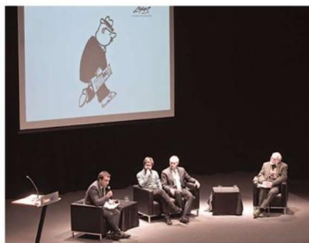
EXITOSA JORNADA DE LANZAMIENTO DEL LIBRO DE LUKAS.

prensa local, particularmente sus reconocidos chistes, que aparecían en la página editorial de El Mercurio, en La Estrella, y las inolvidables tiras del famoso Don Memorario. Pero que también saca a luz sus obras menos conocidas.